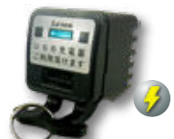
USB-HL 盗難防止 / LED 付