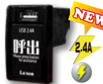
CALL-USB U-type 呼出ボタン一体型 2.4A USB の位置が上のタイプ