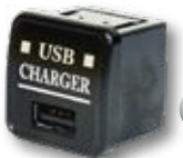
USBチャージャー USB 充電器 1A タイプ