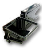
CUP用ケーシングスリム スリム型ドリンク収納