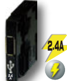
スリムUSB2.4A 台間 1 cm から設置可