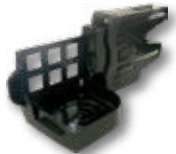
K用ケーシング 小物置き