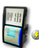
CALL II 照光 LED 付コネクタ