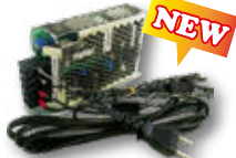
電源 II ハバ - ※USB2.4Aシリーズ 10 個につき 電源 II ハバ -1 台