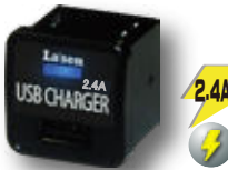
USB-L2.4A LED 搭載 2.4Aタイプ