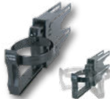
CUP II 首振り型ドリンク収納