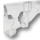
携帯用ケーシング 携帯 & 小物収納