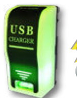
USB III-L 色でお知らせ / 2.4A