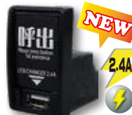
CALL-USB T-type 呼出ボタン一体型 2.4A USB の位置が下のタイプ