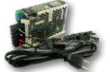
電源 BOX ※USB2.4Aシリーズ 5 個につき 電源 BOX1 台