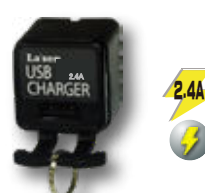
CALL II 盗難防止リグ 付 2.4A