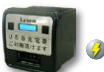
USB-L LED 付 USB 充電器 1A