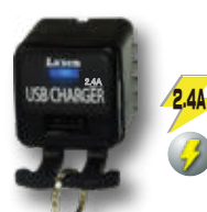
CALL II 照光 盗難防止リグ 付 LED / 2.4A