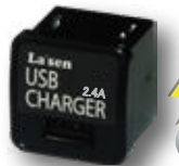
USB2.4A 2.4A 標準タイプ