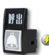
CALL II 台間でのコネクタ