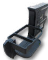
CUP-W ドリンク & 小物収納