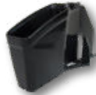
B&C 小物収納 & 玉カップ