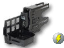
K用ケーシング+USB 充電機能付小物置き