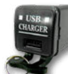
USB-H 盗難防止リグ 付