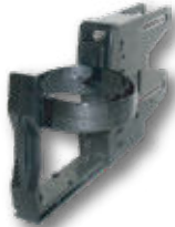
CUP用ケーシング ドリンク収納