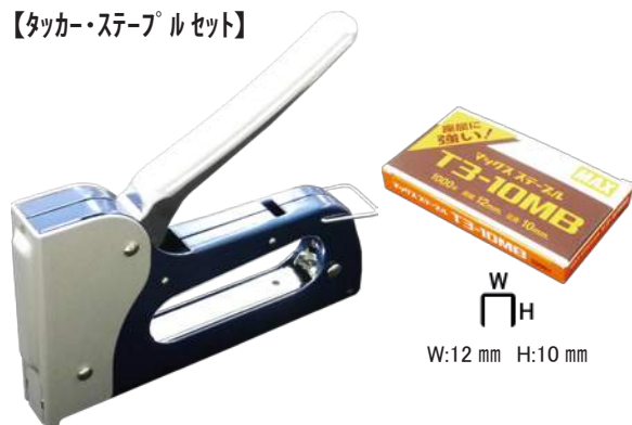
【タッカー・ステッフルセット】